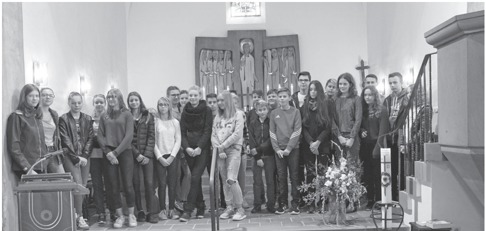
Im Altarraum der Martin-Luther-Kirche versammelten sich alle Konfis, um mit ihren Tutoren der Kirchengemeinde vorgestellt zu werden.