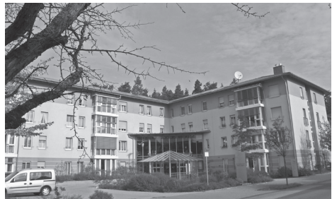
Die Diakonie im Petzhaus.

Hauptstraße 2, 90592 Schwarzenbruck Tel. 09128/924-0 Sprechstunde: nach Vereinbarung