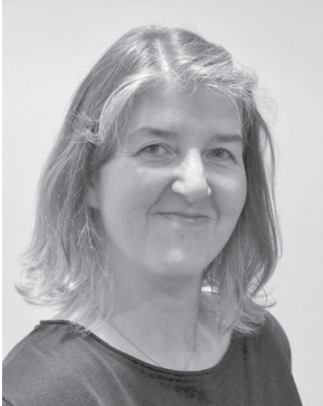
Ursula Koch ist Verfasserin des Artikels.

Im Gemeindebrief Nr. 257 von Großgründlach fiel uns ein Text über die Bibel auf, den wir nach Rücksprache mit der Redaktion an dieser Stelle inklusive des Bildes dankend abdrucken dürfen.